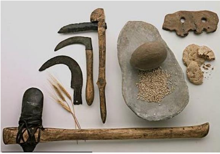
Arado y Hacha

Analiza los siguientes instrumentos, artefactos, figuras y construcciones hechos durante el Neolítico y responde las preguntas.